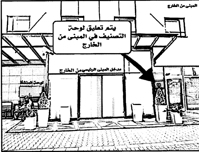
١- لوحة التصنيف يتم تعليقها في المبنى من الخارج وقريب من المدخل الرئيسي للمنشأة.