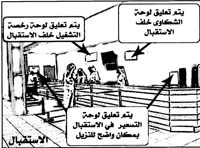
٢- لوحة رخصة التشغيل يتم تعليقها خلف الاستقبال وكذلك لوحة التسعير ولوحة الشكاوى.